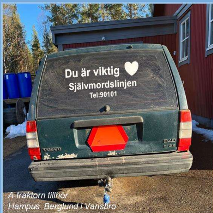
A-traktorn tillhör Hampus Berglund i Vansbro