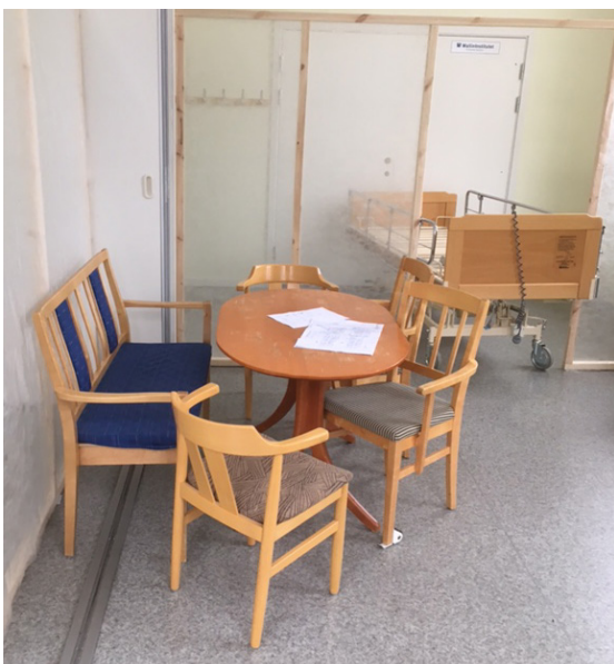
■ Uppbyggnad av provlägenhet inför ombyggnation.

I arbetet med att ta fram en bra planlösning och utformning av ett boenderum har en provlägenhet i skala 1:1 byggts upp. Lägenheten byggdes upp enligt de förutsättningar som fanns för att bygga om befintliga lägenheter på Söderåsens äldreboende. Vid genomgång av provlägenhetens förutsättningar med personal, chefer och politiker konstaterades att utformningen inte skulle stödja den boendes behov och personalens arbetsmiljö.