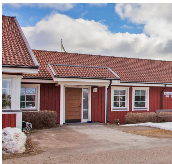
■ Bergheden, Äppelbo.