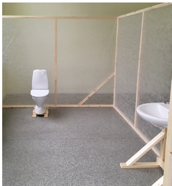
■ En modell av badrum byggdes upp för att åskådliggöra olika lösningar.