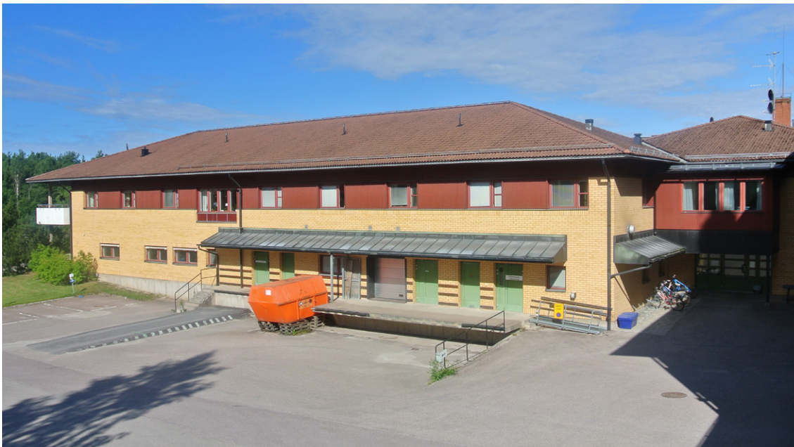
■ Bäckaskog baksida.

Hantering av sopor och avfall tar mycket tid i anspråk på ett äldreboende. Tekniska lösningar som underlättar transporter och minskar personalens tid med hanteringen ska eftersträvas. Det kan vara till exempel centralt placerad sopsug som transporterar bort avfallet. Anpassade lösningar för hantering av avfall ska finnas på eller i direkt anslutning till respektive avdelning. De fraktioner som det ska finnas plats för är enligt kommunens avfallsplan och efter de behov som finns inom äldreboendet. De soprum som iordningställs behöver kyla för att hålla nere temperaturerna och därmed motverka lukt.