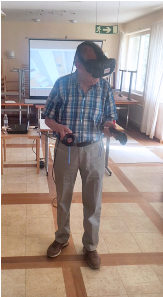
■ Boendet upplevs med hjälp av VR-glasögon i den virtuella miljön.