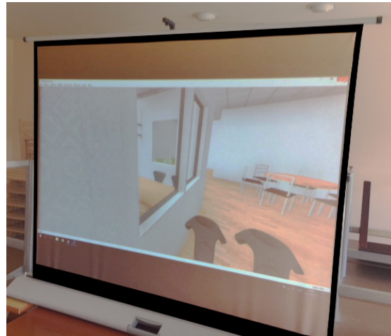
■ Den virtuella världen projiceras på duk.