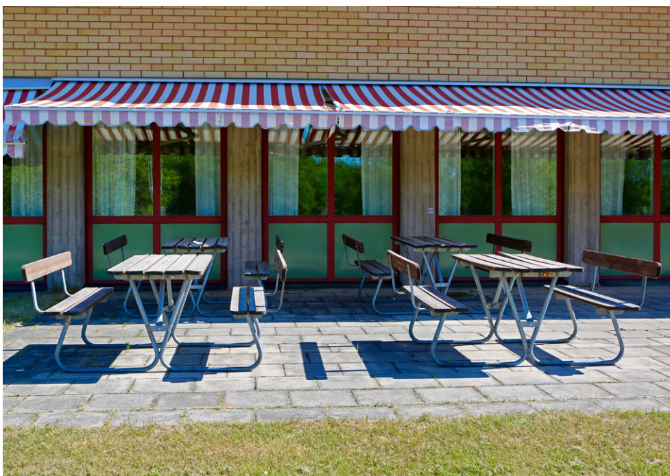
■ Uteplats på Bäckaskog.

Kopplingsnoder för datanätet ska i största möjliga mån placeras i avskilt utrymme till vilket endast behörig personal ges tillträde. Detta ska styras av ett centralt passagesystem och de som beträder utrymmet ska loggas.