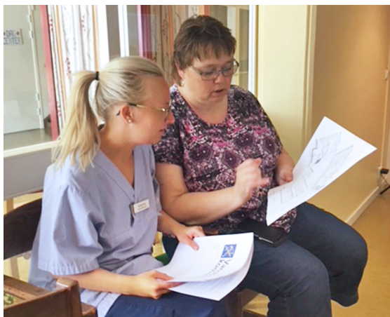
■ Personal går igenom ritningar på det planerade boendet.