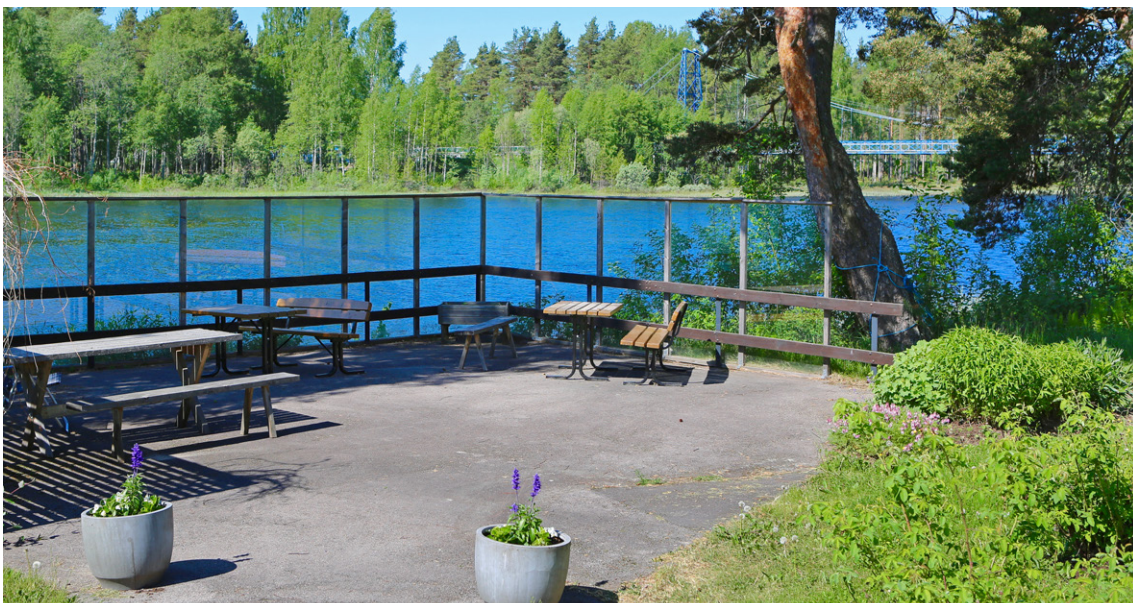
■ Naturskön uteplats med glasat räcke vid Bäckaskogs äldreboende med utsikt ut över Vanån.

Balkonger/terrasser ska tillgodose möjlighet till dagsljus och frisk luft. Vistelse på balkonger/terrasser ska ske under trygga förhållanden. Balkonger/terrasser ska vara stora och rymliga, möjlighet att vistas ute i säng ska finnas. Golvet ska vara lättskött, det ska vara breda dörrar och möjlighet till infravärme. Utesäsongen ska kunna förlängas genom inglasning som är öppningsbar. Möbleringen ska vara lätt att flytta omkring och sittriktiga möbler är av vikt, bord ska kunna fällas ihop och dras ut. Det ska finnas plats för odlingslådor/blomlådor. Det ska gå att avskärma mot för starkt solljus till exempel med markis eller gardin.